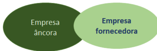
Figura 2: Grupo proponente – Cadeia de autopeças

Poderão enviar propostas grupos compostos por uma empresa âncora e uma de suas empresas fornecedoras, ambas elegíveis a submeter projetos e participar das etapas definidas no concurso.