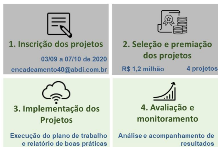
Figura 1: Etapas do edital

Etapa IV: Avaliação e monitoramento dos projetos